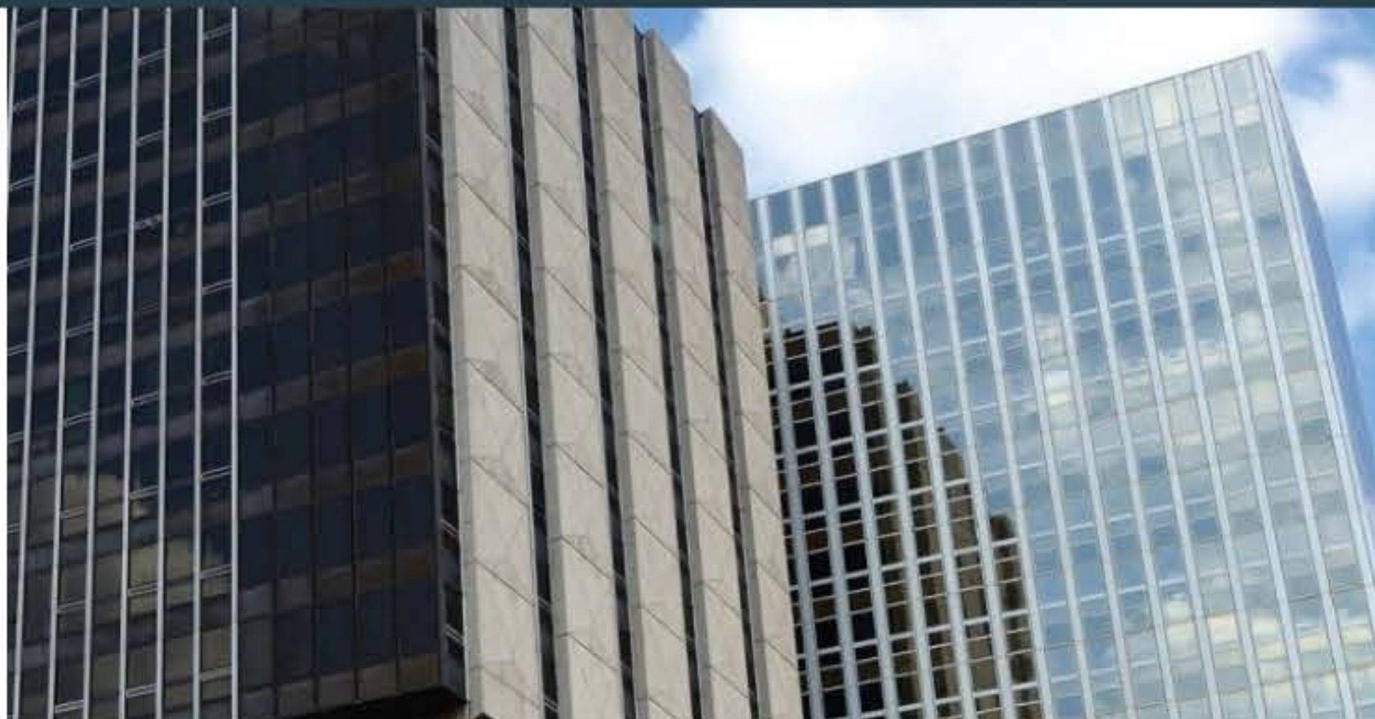
Hôpital Bichat (Assistance Publique - Hôpitaux de Paris)